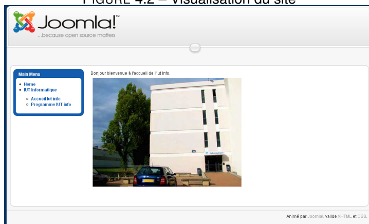
FIGURE 4.2 – Visualisation du site

Vous pouvez revenir changer des options d'affichage des articles précédemment créés (enlever le titre, la date de création...).